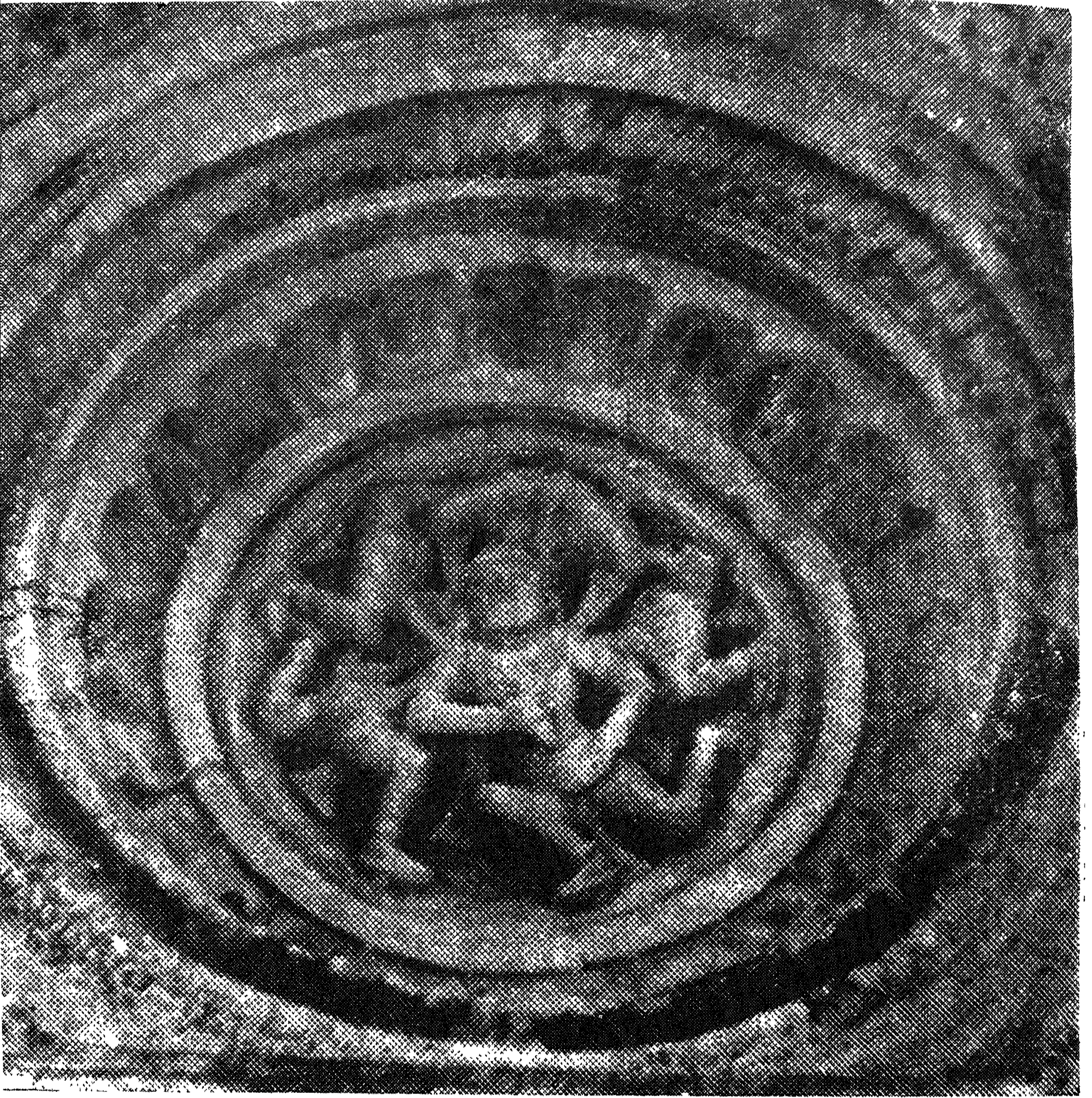
रविदास छतरी की छत पर पंच विकारों की मूर्ति